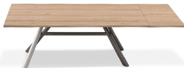
Tavolo Tudor con una allunga / Tudor table with one extension