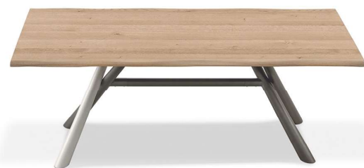
Tavolo Tudor chiuso / Shut Tudor table