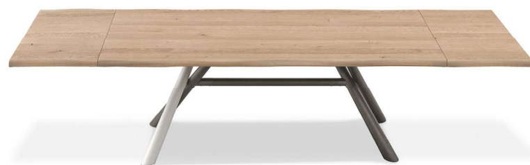
Tavolo Tudor con due allunghe / Tudor table with two extensions